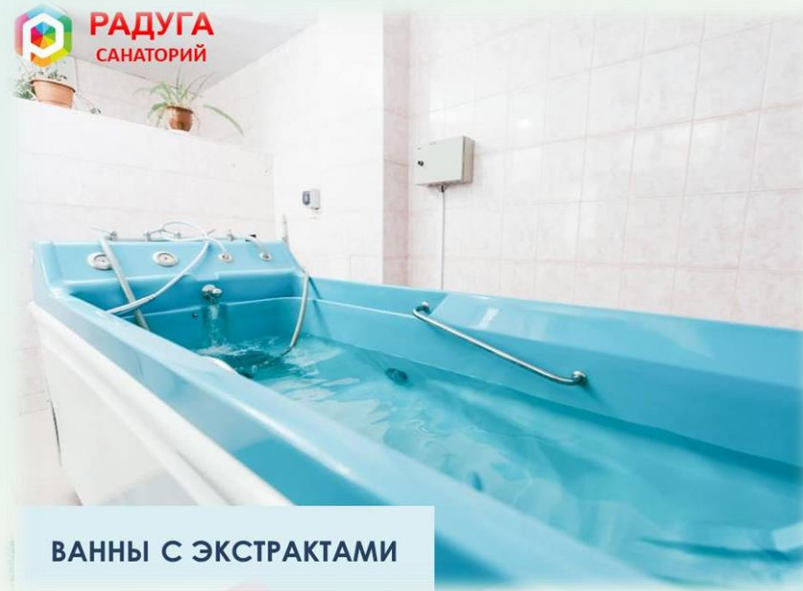
ВАННЫ С ЭКСТРАКТАМИ