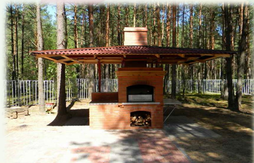
Зона для барбекю sanraduga.by